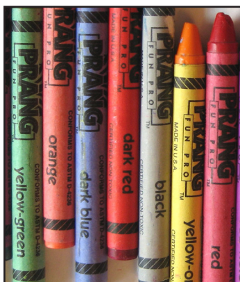
Can see red & green