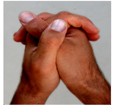
Cruza el dedo pulgar izquierdo encima del derecho