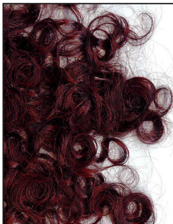
Naturally curly hair