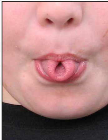
Can roll tongue