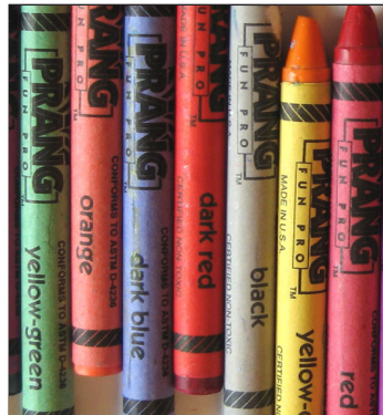
Puede ver el color rojo y verde