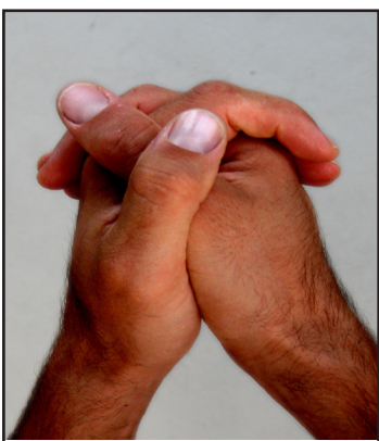
Cross left thumb over right