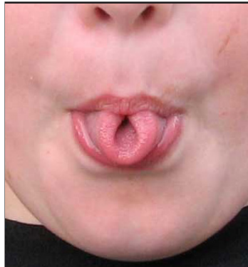
Puede enrollar la lengua