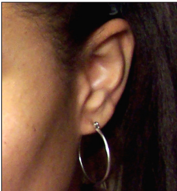
Lóbulos de la oreja unidas